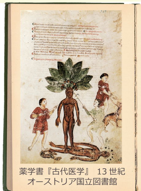
薬学書『古代医学』 13世紀 オーストリア国立図書館

根が人の形に似ていることから、中世の薬学書に描かれるときはいつも人間の姿。さらに引き抜くとすさまじい叫び声をあげ、その声を聞いた者は気が狂い、死ぬとされます。そのため採取はマンドラゴラの茎とイヌの首輪とをロープで結び、引き抜かせていたそうです。危険を犯してまで人々が欲しがったマンドラゴラは、まさに妖しい魅力を持った「魔法のくすり」だったのです。