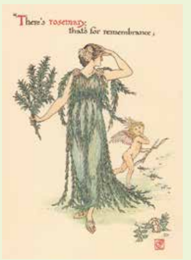
ウォルター・クレイン『シェイクスピアの庭の花たち』より「ローズマリー」1906年

イギリスの劇作家シェイクスピアは作品中に多くのハーブを登場させており、その数180種類以上。そのひとつ、ローズマリーは薬用・香料・料理など現在もよく目にするハーブで、香りには記憶力増進効果がみとめられています。「ハムレット」では父を殺され、恋人にまで捨てられたヒロイン オフィーリアが精神錯乱に陥り、兄を恋人と間違え「これがまんねんろう(ローズマリーの和名)、あたしを忘れないように—ね、お願い、いつまでも」と言いローズマリーを手渡します。シェイクスピアは登場人物のセリフにハーブの色・薬効・香りをを用いることで、劇中の場面をより印象付けています。右は20世紀初頭に芸術家クレインが著した『シェイクスピアの庭の花たち』の1頁。ローズマリーをまとった女性は頭に手を当て、何かを思い出す仕草をしています。そして彼女の後ろにはこの植物の花言葉「変わらぬ愛」より、愛の天使クピドが描かれています。